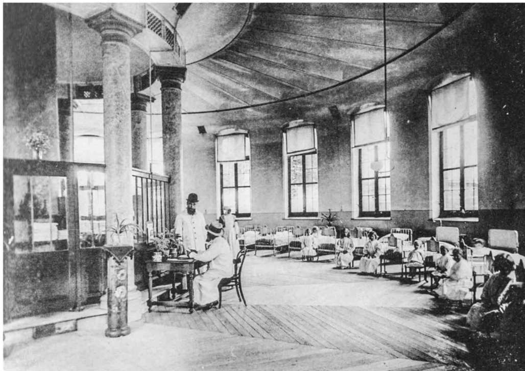
De ziekenzaal van het Stuivenberggasthuis, dat er kwam toen de Blauwe Dood heerste: cholera.