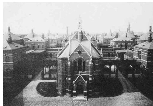
Een historische foto van het Stuivenbergziekenhuis. Zicht op de kapel.

Op de plek van dat 'pesthof' staat vandaag het Stuivenberggasthuis. Dat kwam er in de peri-